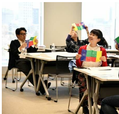
各団体の資料も多数配布された

（東京都奥多摩町）のプレゼン動画は東京とは思えないほどの豊かな自然が織り込まれるとともに、住民を巻き込んで行われている多様な地域おこしの取り組みに参加者の多くが圧倒されました。なお、それぞれのプレゼン資料は http:// bit.do/fFn9T で閲覧可能です。