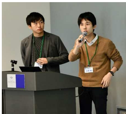
報告にも熱がこもる

二日目の活動報告でも、地域おこしやボランティアコーディネート、若者の自立支援やまちづくりといった多彩なテーマで報告がありました。中でもA会場で報告された長崎県立五島高校（長崎県五島市）には、総合学習の時間での環境保護や観光の取り組みに多くの関心が寄せられました。また、B会場で報告された Ogouchi Banban Company