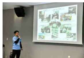
画像を使って報告