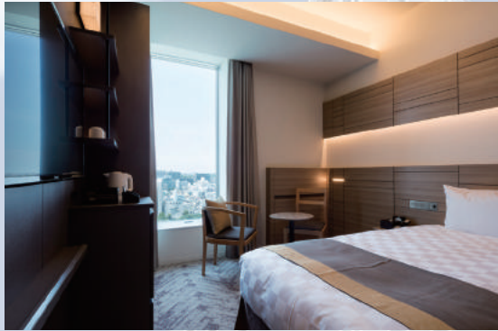
スーペリアシングルルーム (ツイン対応可能)

やさしいブラウンを基調としたシンプルかつ洗練されたデザイン。 落ち着いた空間の中で、寝心地のよいベッドで快適にお過ごしいただけます。